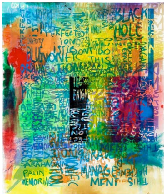
Rochelle Feinstein, Research Park Project: Ee , 2014 Acrílico impreso sobre lienzo aplicado en pantalla serigráfica manualmente. 80-1/2 x 71-1/2 in.

Único; Realizado por USF Graphicstudio