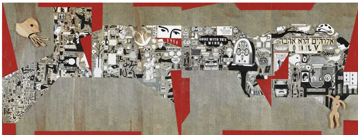
Deborah Grant, Crowning The Lion and The Lamb (Coronación del León y el Cordero), 2013

Tampa, 5 de septiembre de 2014 – El USF Contemporary Art Museum se complace en anunciarles la inauguración de la muestra Making Sense (Construir Significado): Rochelle Feinstein, Deborah Grant, Iva Gueorguieva, Dona Nelson a partir del 26 de septiembre y hasta el 12 de diciembre de 2014.